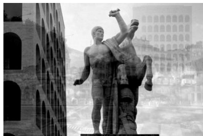
"My Own Rave" (Roma) Stampa su Plexiglass, 2008