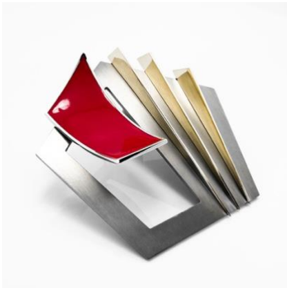
SPILLA/CIONDOLO, Titanio, Oro, Argento e Smalto, 2021