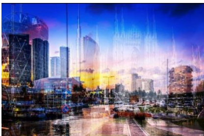
"My Own Rave" (Milano-Miami) Stampa su Plexiglass, 2021