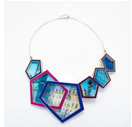
COLLANA, Argento, Smalti, Stampa su PVC, 2021