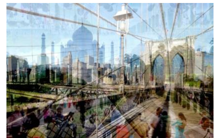
"My Own Rave" (New York-New Dheli) Stampa su Plexiglass, 2019

Si prega di scrivere all'indirizzo marco@babsartgallery.it per fotografie o ulteriore materiale.